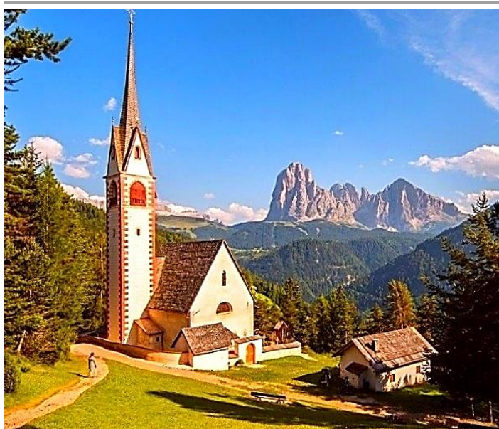
Ortisei (BZ): VIVERE LA VAL GARDENA

ISCRIVERSI PER PARTECIPARE. Pagare la quota in Sede o in banca (Iban: IT03Y 03069 09606 1000 00017244). Comunicare cognome e nome, data e luogo di nascita, indirizzo, Cap, telefoni, indirizzo di posta elettronica